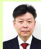
議長 萩原 光典